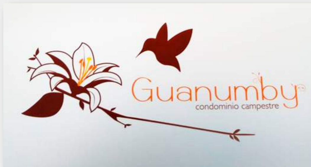
CONDOMINIO GUANUMBY SPA Y RESORT CAMPESTRE